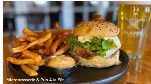
Microbrasserie &amp; Pub À la Fût

La salle à manger le Godefroy offre une cuisine légère et raffinée dans un décor moderne, chic et épuré. Notre brigade crée des plats savoureux à partir des meilleurs produits d'ici pour offrir une cuisine de qualité aux tendances et aux saveurs actuelles.