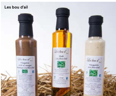
Les bou d'ail

Entrez dans le monde fascinant de la Maison la Tradition. Vous découvrirez notre centre d'interprétation rempli de trésors de famille, d'ouvrages et d'œuvres de nos artisans distinctifs (plus de 150). Notre personnel d'accueil guidera votre visite expliquant nos réalisations où la récupération, le recyclage et la réutilisation sont le tremplin d'une nouvelle économie. En constante évolution, notre gamme de produits écologiques est disponible à notre atelier-boutique ouvert à l'année. Animation de groupe sur réservation.