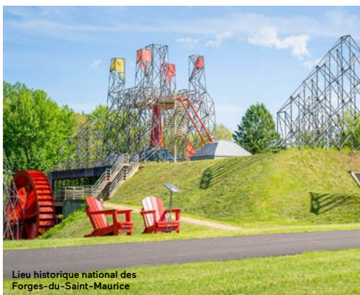
Lieu historique national des Forges-du-Saint-Maurice

Visitez le moulin à farine datant de l'époque seigneuriale et la scierie construite au milieu du 20 e siècle. L'exposition Maître meunier vous dévoile le quotidien des meuniers d'antan et les secrets de la fabrication de la farine. L'exposition Farine de bois explore, quant à elle, la scierie adjacente et vous permet de goûter à la réalité des travailleurs du bois d'autrefois. Terminez votre visite par une balade dans les sentiers.