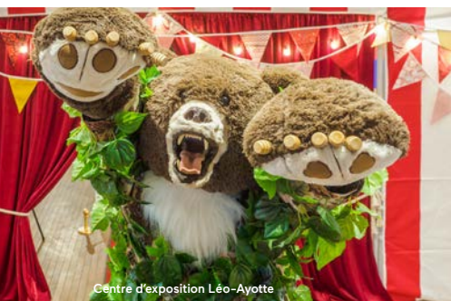
Centre d'exposition Léo-Ayotte