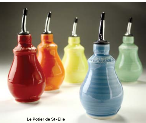
Le Potier de St-Élie