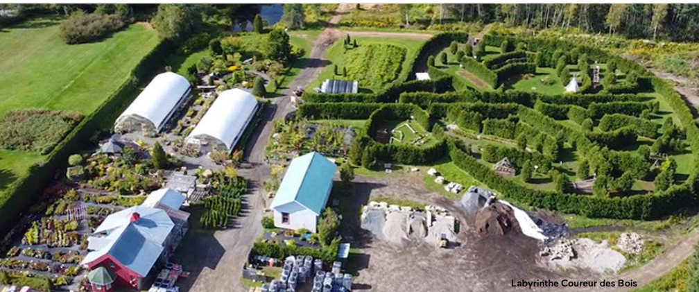
Labyrinthe Coureur des Bois

Un drame s'abat sur un poste de surveillance maritime à Batiscan. Empruntez le rôle d'enquêteur, fouillez la pièce et relever des indices afin d'en apprendre davantage sur cet office des signaux. Vous n'aurez qu'une heure pour élucider le mystère qui plane dans ce lieu authentique et unique au Québec. Jeu d'évasion sur réservation uniquement. Visite libre ou guidée du musée possible. Boutique d'artisanat sur place.