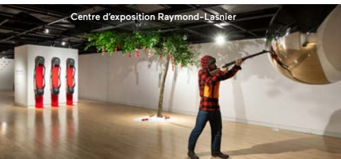
Centre d'exposition Raymond-Lasnier