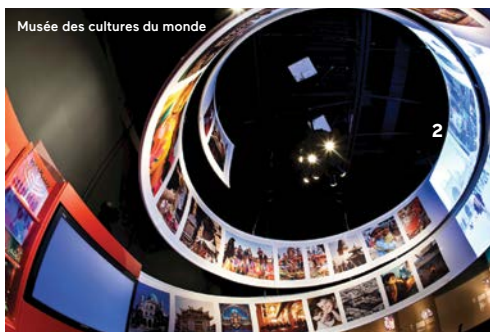
Musée des cultures du monde

Exposition consacrée aux relations internationales et au rôle du Canada sur la scène mondiale. Le très honorable Jean Chrétien a reçu de nombreux cadeaux d'une valeur inestimable à titre de Premier ministre. À ce volet d'exposition se greffent les thèmes du commerce international, de la diplomatie, de la paix et sécurité et du développement international qui sont vulgarisés par du matériel audiovisuel et des bornes interactives très perfectionnées.