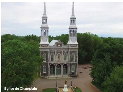
Église de Champlain

Visitez l'Église de Champlain avec un regard neuf, celui de la réalité augmentée. Prêtez-vous à cette nouvelle expérience technologique où un personnage historique fictif prend vie sur votre tablette. Suivez-le dans les allées alors qu'il vous parle du quotidien des Champlinois vers 1908. Profitez également des visites guidées en saison estivale pour découvrir près de 350 ans d'histoire et l'impressionnant décor en trompe-l'œil qui fait de l'église de Champlain un monument historique national.