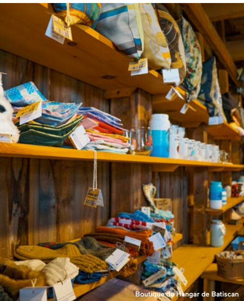
Boutique du Hangar de Batican