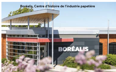
Boréalis, Centre d'histoire de l'industrie papetière

Découvrez un musée passionnant où vous sera racontée l'histoire de la grande aventure du papier! Cet ancien lieu industriel vous permettra de parcourir un réservoir souterrain unique, de fabriquer votre propre papier et de mettre vos 5 sens à l'épreuve. Profitez de votre venue pour vous prélasser au soleil sur la terrasse extérieure et accédez à une tour d'observation dont la vue magnifique donne sur la Saint-Maurice.